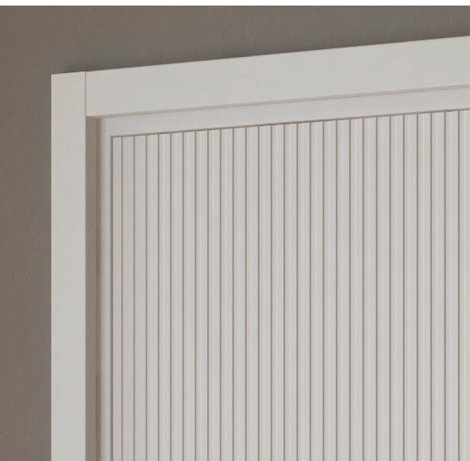
Рисунок на цельной поверхности полотна выполнен по технологии фрезерования. Она неглубокая, но мягкая и выразительная. Игра света и тени в гладких канавках усиливает этот эффект: полотно смотрится по-разному в дневное и вечернее время, при естественном свете и искусственном освещении.